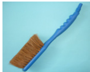
洗車ブラシ バーム