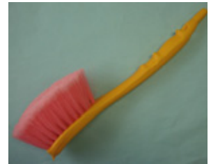
先割ピンクナイロン