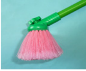
長柄洗車ブラシ ざおう