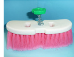
長柄洗車ブラシ スーパーざおう スペア