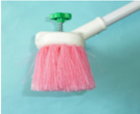
長柄洗車ブラシ スーパーざおう 出水式