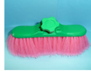
長柄洗車ブラシ ざおう スペア