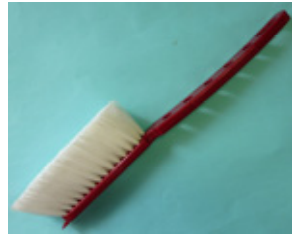
サンワ 洗車ブラシ 先割