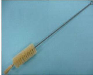
バキン機械掃除ブラシ