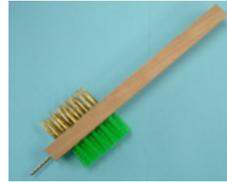
ガス器具掃除ブラシ