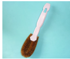
シューズブラシ ヘラ付