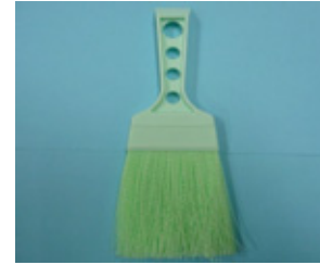
キューティークリーン