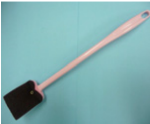
ニュートイレッター