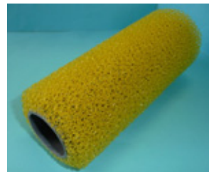
マスチックローラー スペア