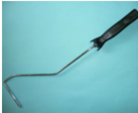
スモールローラー100m/m・150m/m兼用 ハンドル