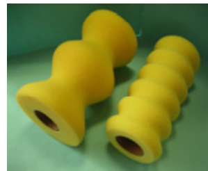
スポンジローラー スペア 大波・小波