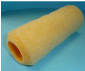
ホームローラー スペア