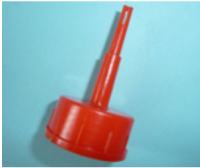
ペロットローラーB型 スペア