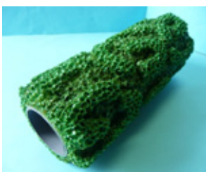
デザインローラー スペア