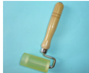
ウレタンローラー ベアリング入り