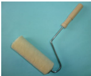
木柄ローラーブラシ セット