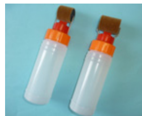
ベロットローラーA型 セット (ボンド用)