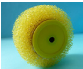
ニューマスチックローラー スペア