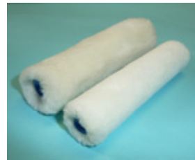
特白スモールローラー スペア