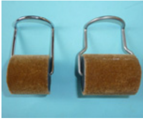
ペロットローラーA型 スペア