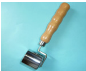
鉄 シームローラー