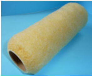
ワンタッチローラー スペア 茶 VP