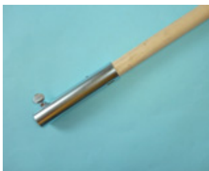
木柄ローラー用 つぎ柄