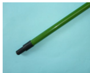
ワンタッチローラー用 つぎ柄（スポット）