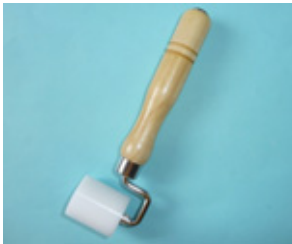
ジュラコンローラー ベアリング無し