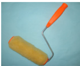
ミックスローラー セット