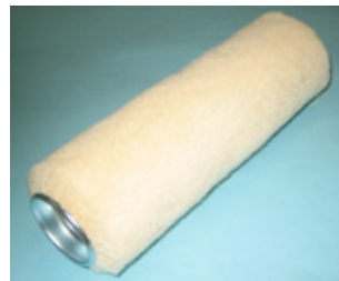
木柄ローラーブラシ スペア