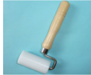
ジュラコンローラー ベアリング入り