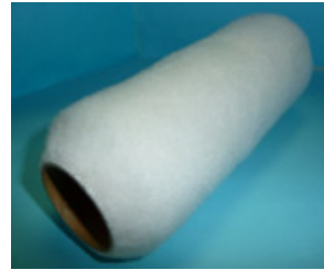
特分ワンタッチローラー スペア 白