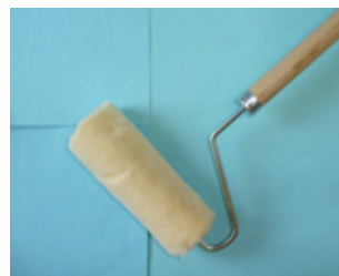
長柄直結式ローラー（木柄）