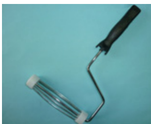
ワンタッチローラー用 ハンドル