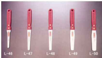
柄部：ABS樹脂 身部：ミラー研き