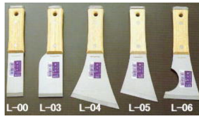
柄部：白木グリップ 身部：サテン研ぎ