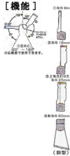
くるりん4の使い方