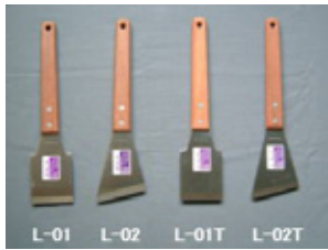
柄部：強化木ロンググリップ 身部：サテン研ぎ