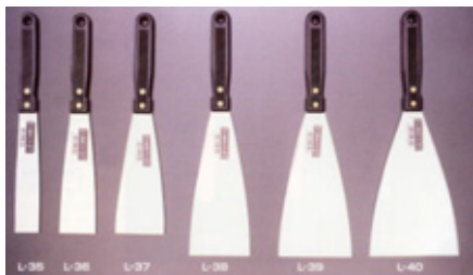
柄部：ABS樹脂 身部：ミラー研ぎ