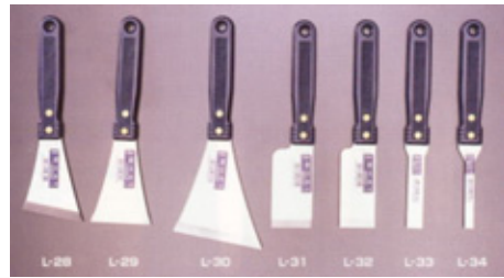
柄部：ABS樹脂 身部：ミラー研ぎ