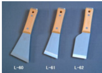
柄部：天然木柄 身部：サテン研き