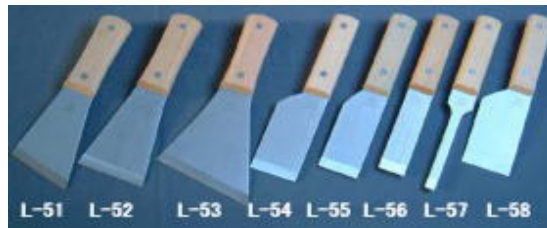
柄部：天然木柄 身部：サテン研き