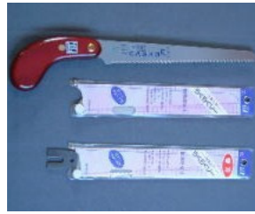
柄部：天然木柄 身部：ミラー研ぎ