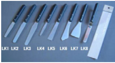
柄部：黒塗木柄 身部：ミラー研ぎ