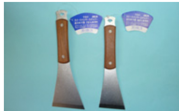
柄部：天然木柄 身部：電解仕上げ